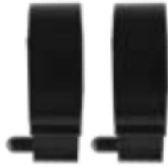
Spool (orsó) tartó 5kg, d200mm Kód: 601412000L