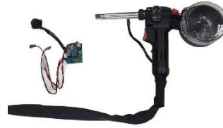
Spool-Gun pisztoly + Illesztőkártya Kód: 600513000L