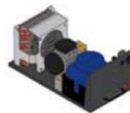
VÍZHŰTŐ AWC MPS Kód: 601471000L Hűtőrendszer a TIG és a MIG/MAG vízűtéses hegesztőpisztolyokhoz Hűtési hatékonyság P = 1 KW (1L/perc) Áramlás mértéke a 18 8mt TIG pisztollyal = 1,7L/perc