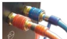
Vízcső hosszabbító Kód: 601408000L