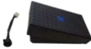
Távírányító LÁBKAPCSOLÓ Cad 4,5m Kód: 600102000L