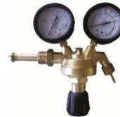
GÁZSZABÁLYOZÓ 2 MÉRŐÓRÁS Kód: 6055900000 Gázsabályozó 2 mérőórás (olasz szabvány)