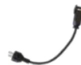
Vízűtő dugaszoló KÉSZLET Kód: 601413000L