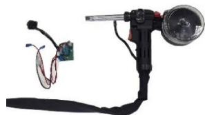
Spool-Gun pisztoly KÉSZLET Kód: 600513000L

A praktikus kézikocsi segítségével az áramforrás bármilyen talajon biztonságosan és könnyen mozgatható.